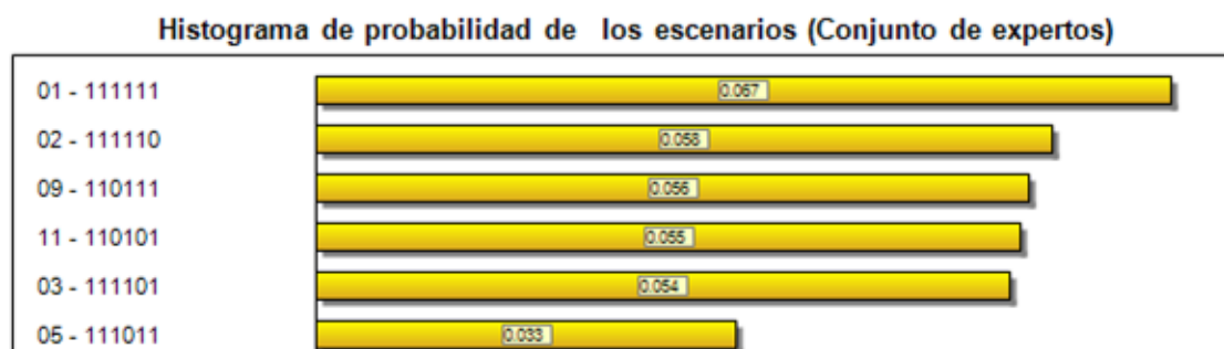
Grafico 1: Histograma

Con el procesamiento de la SMIC se obtiene en el histograma de probabilidad de realización de los escenarios constatándose que de los 64 escenarios todos tienen probabilidades de ocurrencia y constituyen el campo de los escenarios realizables, de ellos se toman los 6 de mayores probabilidades de ocurrencia